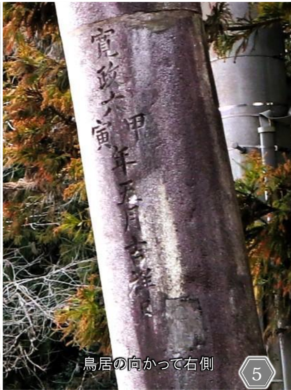
鳥居の向かって右側