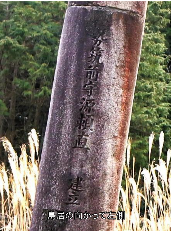
鳥居の向かって左側