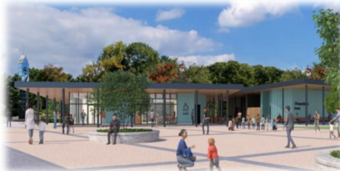
レストハウス 改修イメージ (位置図⑨)