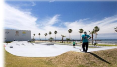
スケボーパーク 整備事例 (位置図④)