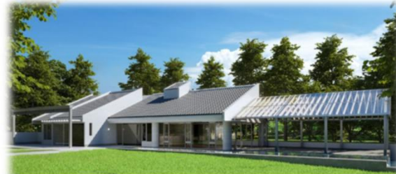
sasa (イタリアンレストラン) R6.7.16 OPEN (位置図⑩)