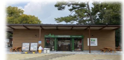
Good BBQ 服部緑地バーベックマルシェ売店 R6.3.1 OPEN