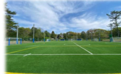
フットサルコート R6.4.20 OPEN (位置図⑤)