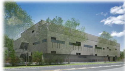
複合型温浴施設 整備イメージ (位置図②)