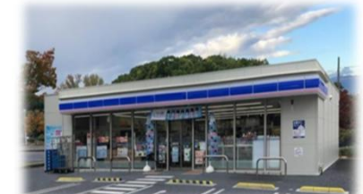
ローソン R6.2.16 OPEN (位置図③)