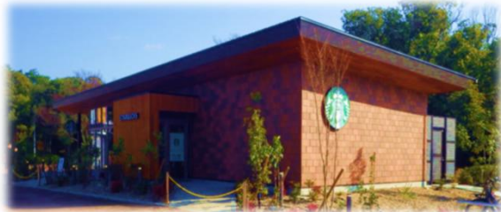
スターバックス 服部緑地店 R6.1.25 OPEN (位置図①)