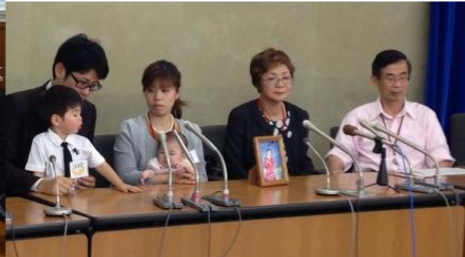
2013年6月19日大臣要請・記者会見(1回目)