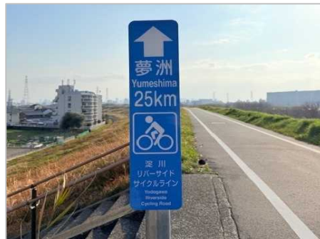
淀川リバーサイドサイクルライン 案内サイン