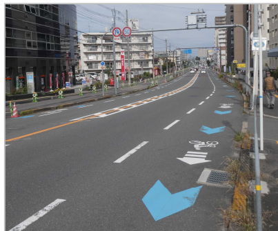
一般道における矢羽根型（標準形）路面表示