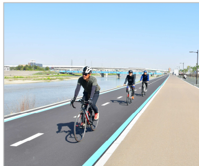
河川空間を活用した自転車歩行者専用道路