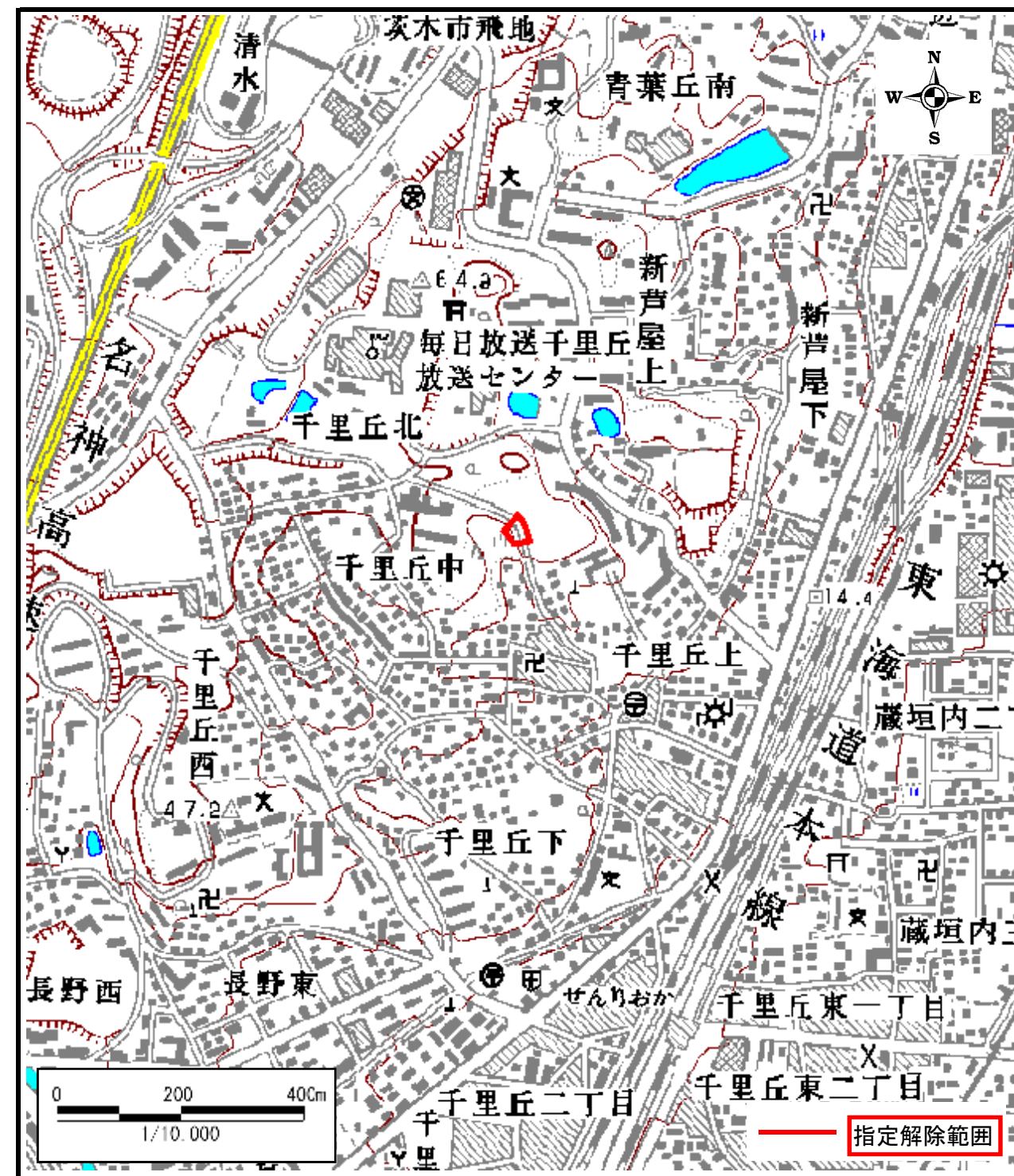
区域指定解除箇所位置図(1/10,000)