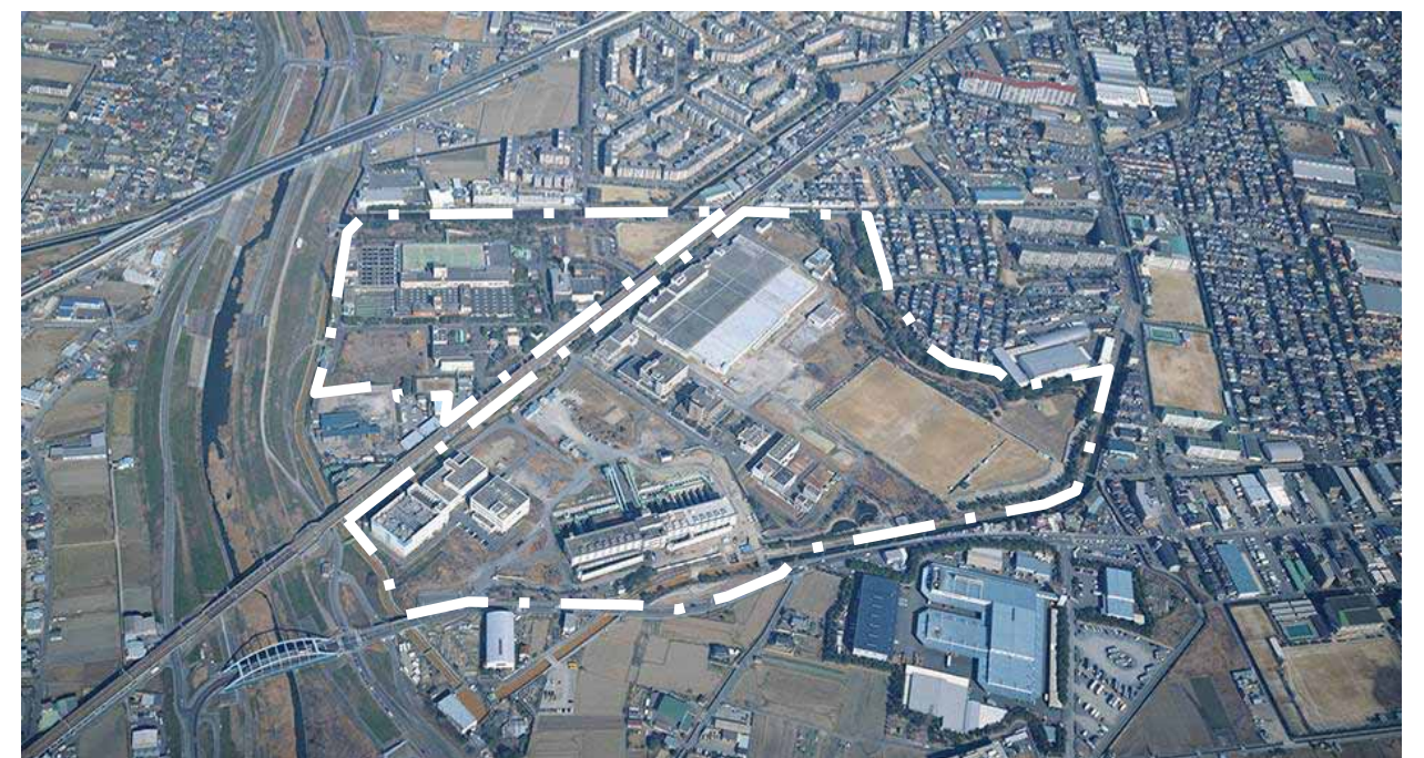
高槻水みらいセンター(処理場)