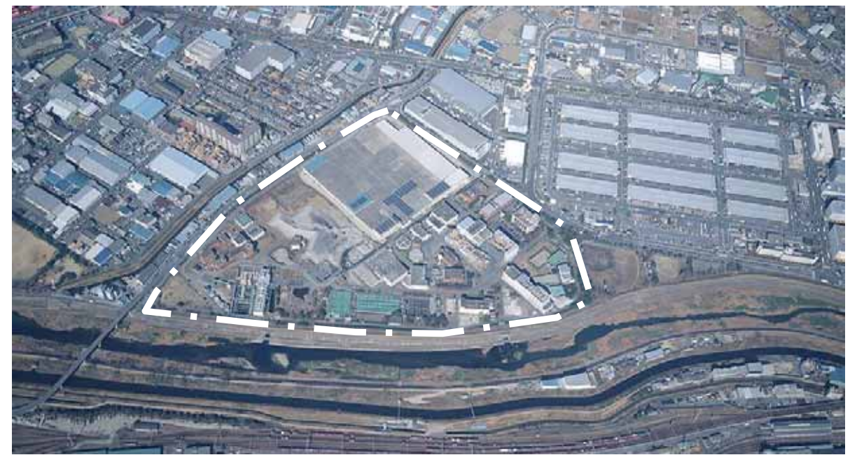
中央水みらいセンター(処理場)