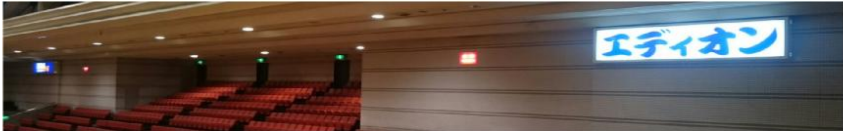
※第1競技場内、物件No.1及びNo.2における使用状況写真

電照広告とは、 蛍光灯によるバックライトにより、距離が離れたところからでも人々の目を集めやすく 高い広告効果が得られることから、長期にわたる企業・商品・サービスのイメージ広告 として、駅周辺の店舗案内等に多く利用されています。