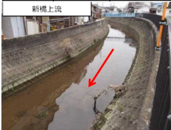
◇現況河道（田尻川） 時間雨量80ミリ程度の降雨を対象とした改修完了