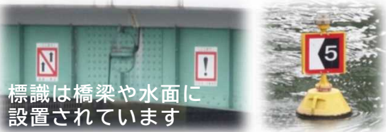
標識は橋梁や水面に設置されています