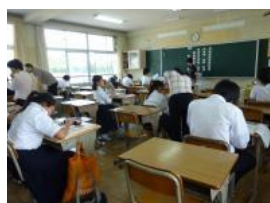
生徒たちは、落ち着いた雰囲気での 学習に取り組んでいる