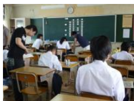
社会人の学習アドバイザーをはじめ、様々な学校関係者が自主的に 学習を支援