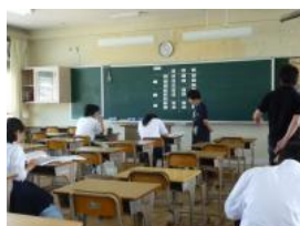
中央が学生ボランティアの 学習アドバイザー