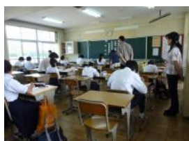
学習のようすを見守る 学校支援コーディネーター(右)