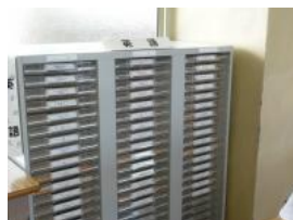
数学・英語の教材プリントを整備 (大阪府の学習指導ツール等を活用)