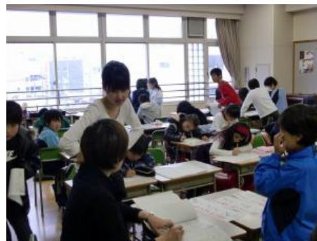
ボランティアによる