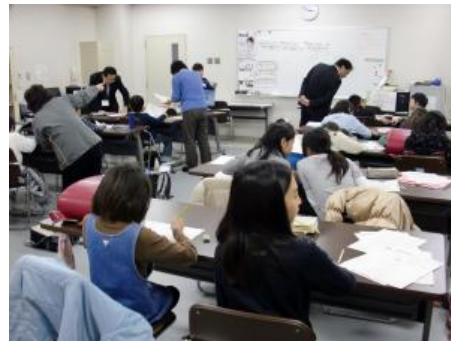
みんな熱心に学習しま