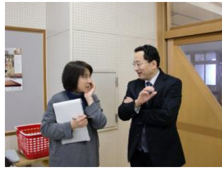
校長にインタビューするアドバイザー