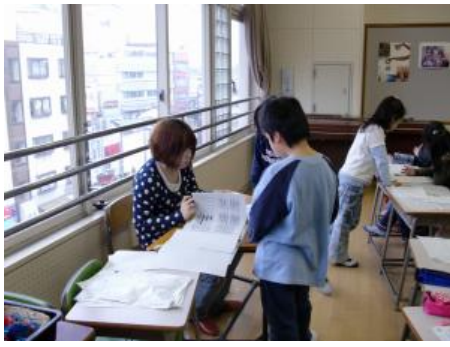
学生スタッフによる指導