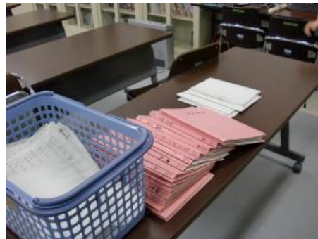
児童のプリント整理用ファイル