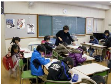
退職教員による指導