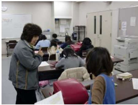
退職教員による指導