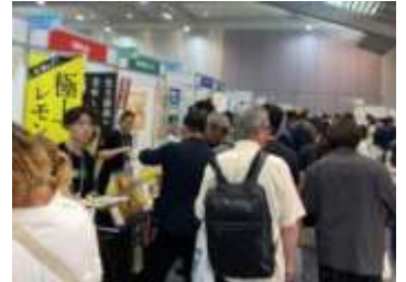
居酒屋JAPAN2025 開催時の様子▲