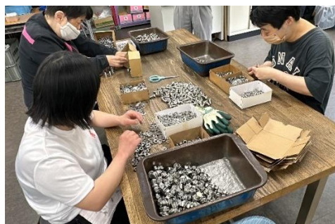
ネジの組み立て作業