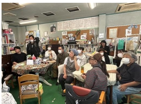
毎朝のミーティングの様子