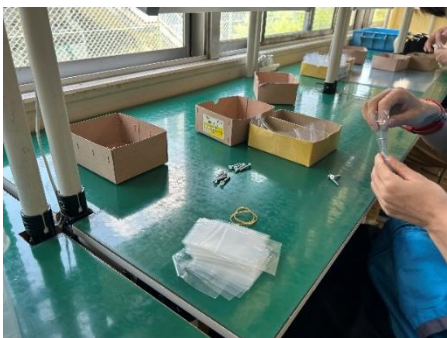
ネジの袋詰め作業