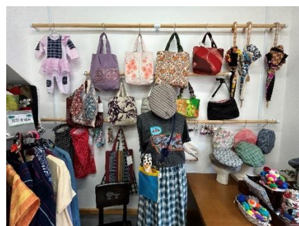
アトリエ&ギャラリー「ふくもち」