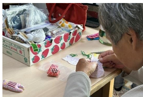
アップサイクル商品を製作する様子