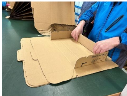
段ボール組み立て作業