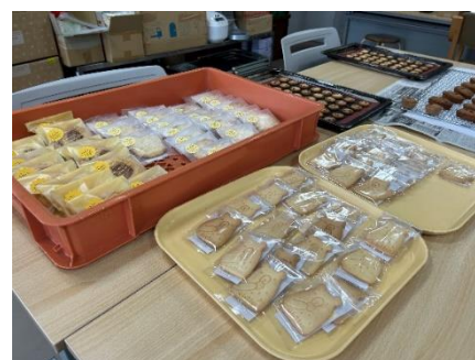
焼き菓子の製造風景