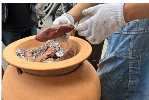
つば焼き芋「ここいも」