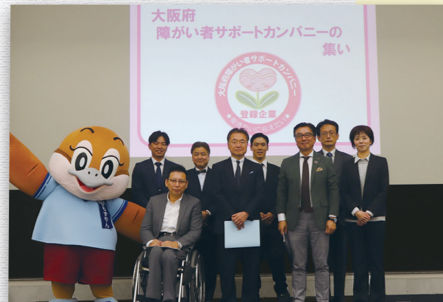
「サポートカンパニーの集い」の様子