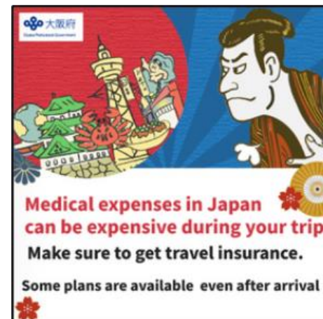
▼バナー広告のイメージ

・Facebook広告 ⇒大阪府のFacebookアカウントを使用 使用言語 + 興味関心 (よく旅行をする人、興味関心) に応じて表示