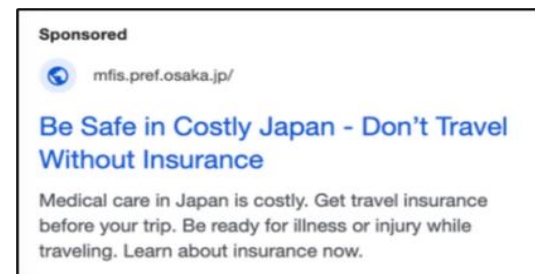
▼リスティング広告のイメージ