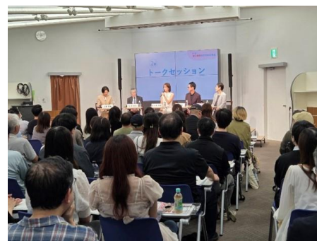
▲がん検診にいきこうキャンペーン