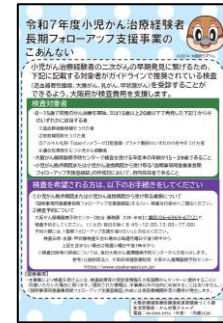
【小児がん治療経験者長期フォローアップ支援事業チラシ】