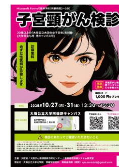
▲大阪公立大学での子宮頸がん検診啓発チラシ