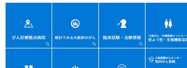
【がん情報サマリー（大阪がん情報ウェブサイトより）】