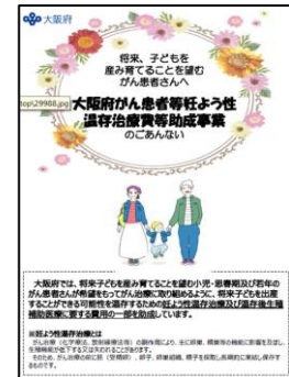
【大阪府がん患者等妊よう性温存治療費助成事業チラシ】