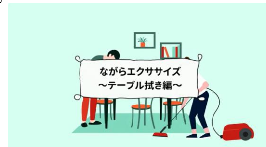
【運動支援エクササイズ動画】