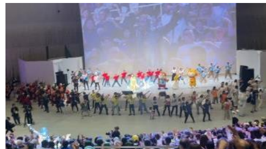
▲「健活10 EXPO LIVE！」