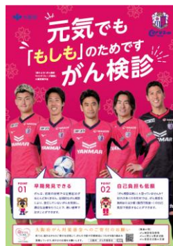
▲連携企業によるがん検診の普及チラシ