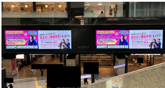
▲南海なんば駅での周知