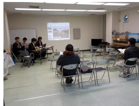
会場：岬町住民活動センター