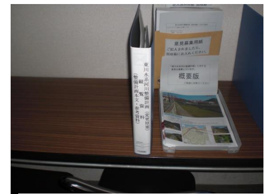
岬町役場 情報公開コーナー