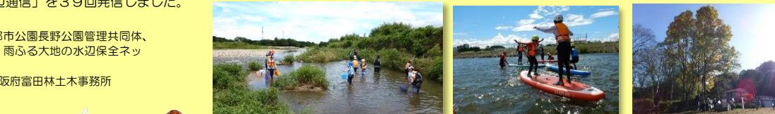
石川流域いきものキッズの状況