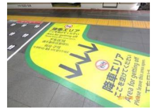
【床面整列乗車シート】