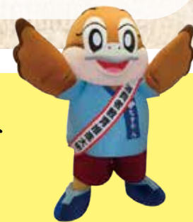
消費者教育推進大使 もずやん