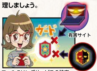
フィルタリングサービスの設定 有害アプリ

お子さまのアカウントを管理、利用できる機能にあらかじめ制限をかける「ペアレンタルコントロール」を活用しましょう。また「フィルタリングサービス」は、不適切な情報へのアクセスを遮断したり、インターネット上でのトラブルを防いだりするのに役立ちます。