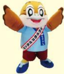
消費者教育推進大使 もぎやん