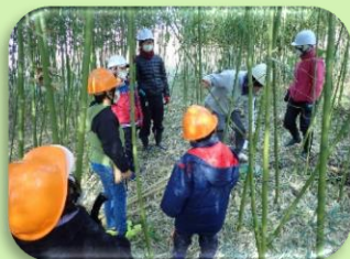
府民参加型定例活動の様子