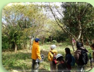
自然体験ハイキングの様子