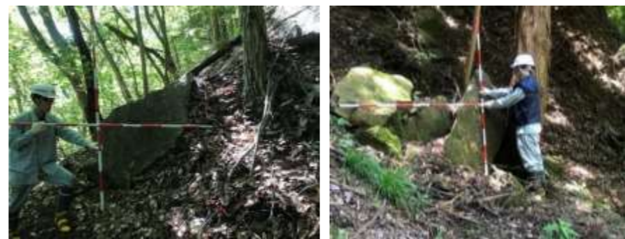
歩道斜面沿いに落石の恐れがある危険な状況