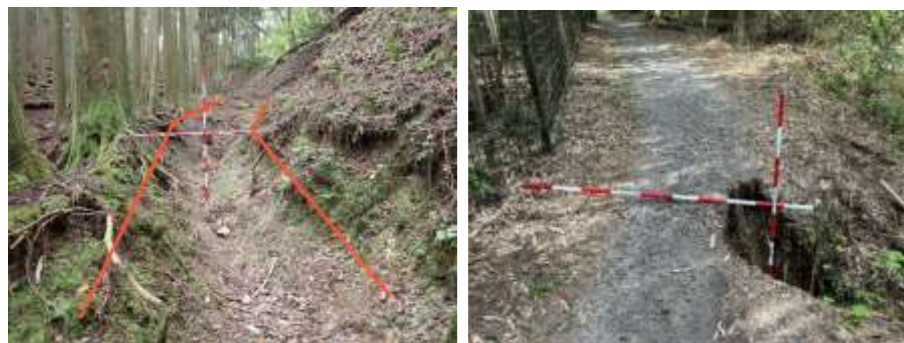
歩道の路肩が崩壊して通行が危険な状況