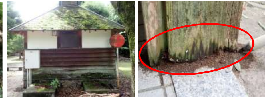
トイレの柱下部が老朽化により腐朽しており、構造上に損傷がある状況