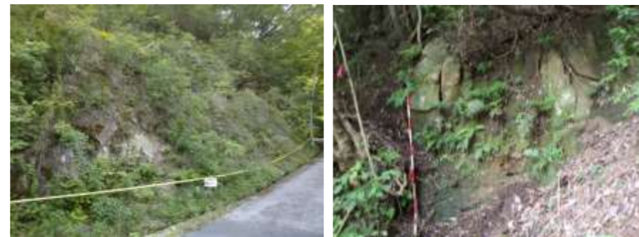
歩道斜面沿いに落石の恐れがある危険な状況