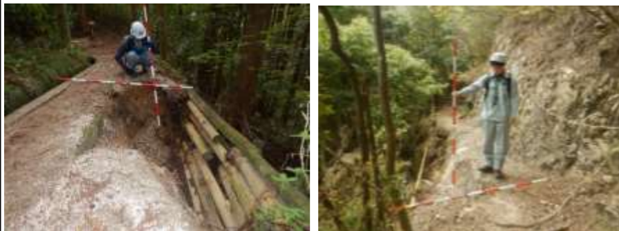
歩道の路肩が崩壊して通行が危険な状況