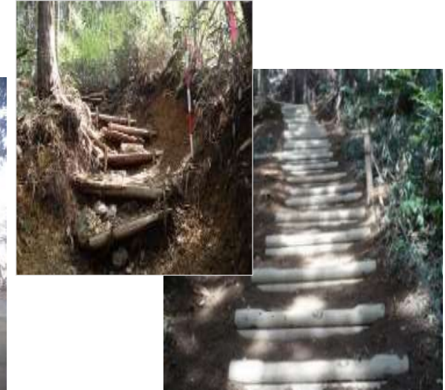
管理道等の安全対策