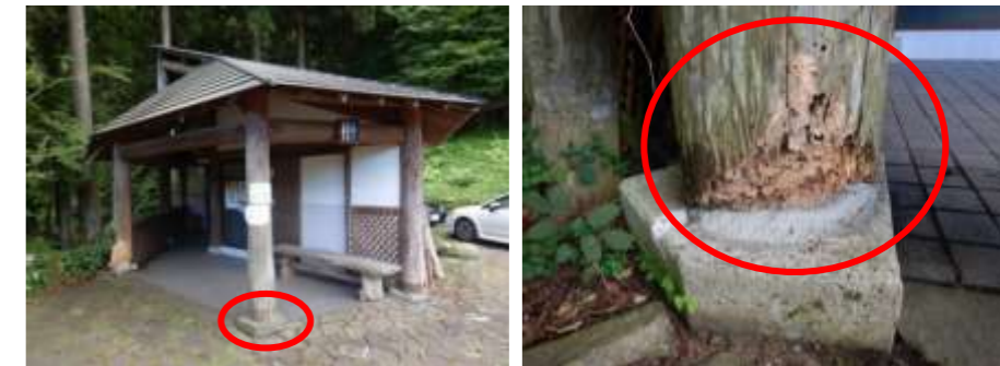
トイレの柱下部が老朽化により腐朽しており、構造上に損傷がある状況