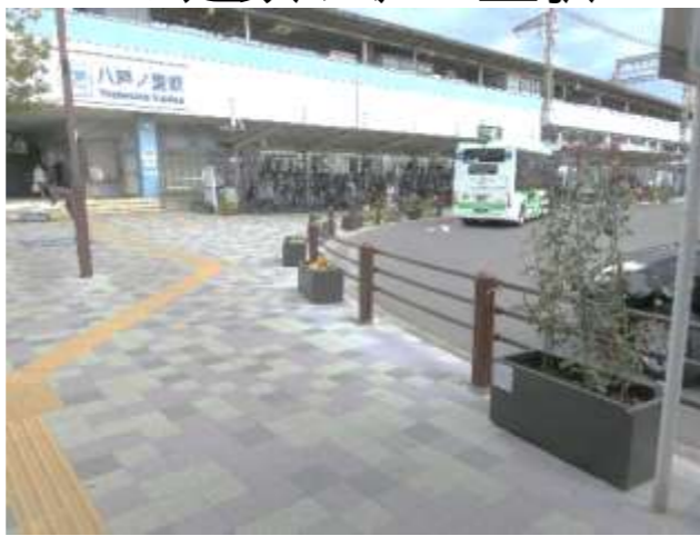
18.近鉄・八戸ノ里駅