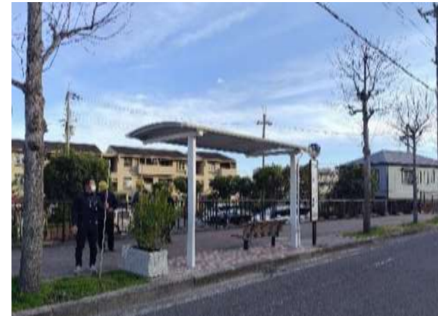
46.紫金山公園前(西行)