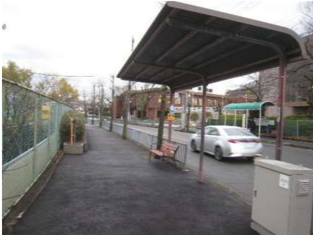
60.福祉センター前(東側)