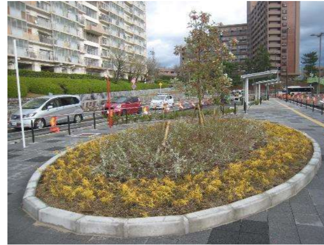
7. 梅・美木多駅(南口)