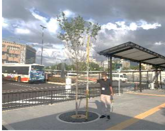
1. 梅・美木多駅(北口)