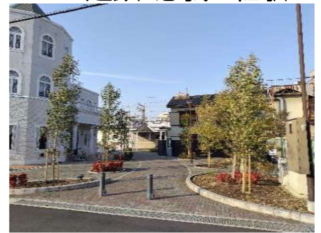
20.近鉄・恵我ノ荘駅