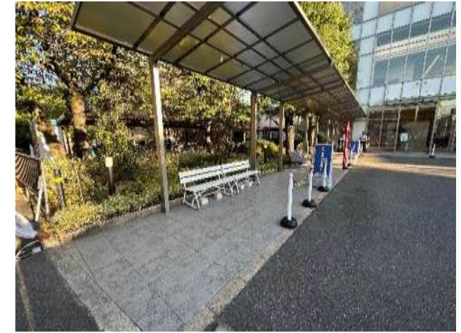
43.THE AINO'S SQUARE