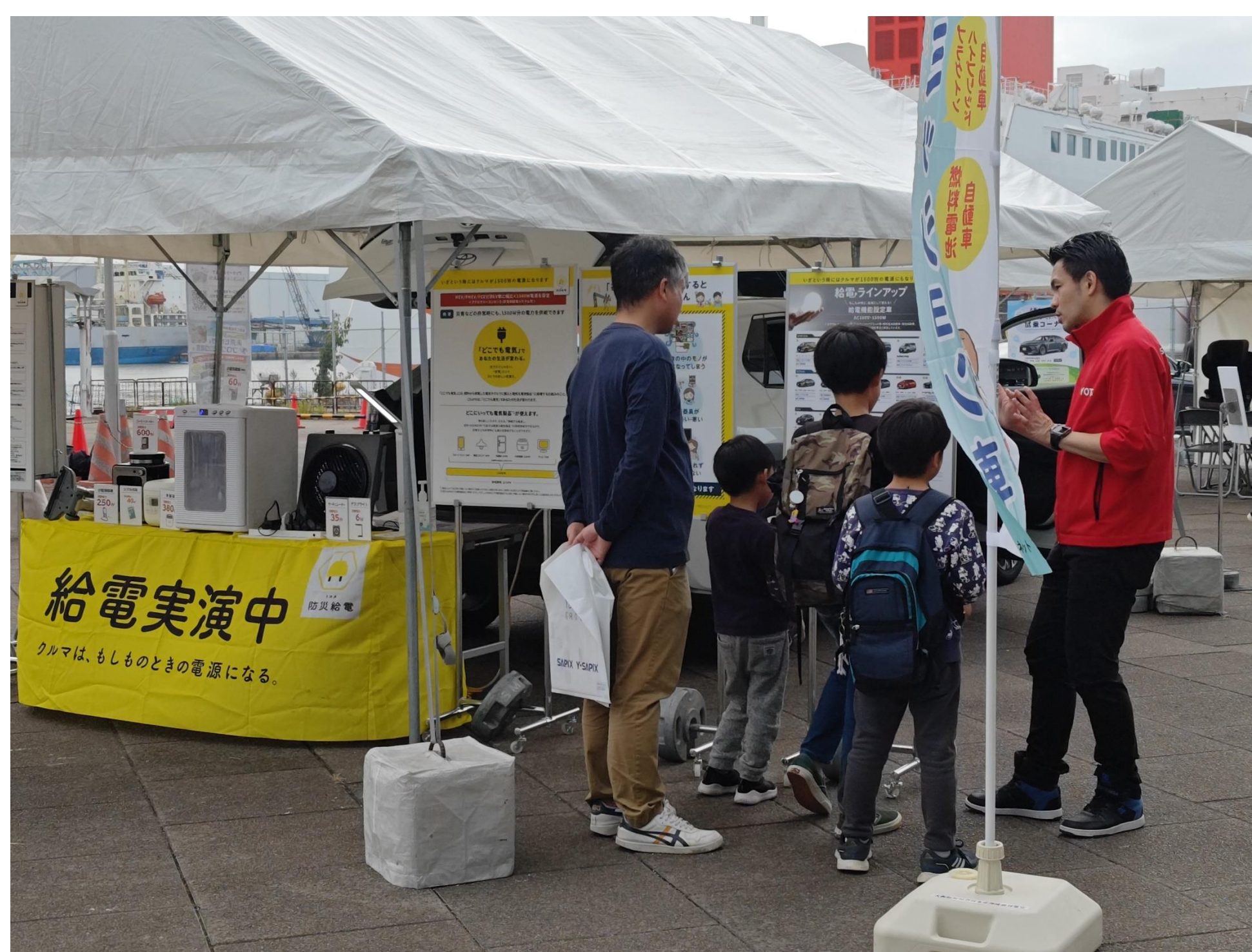
イベントでの給電体験