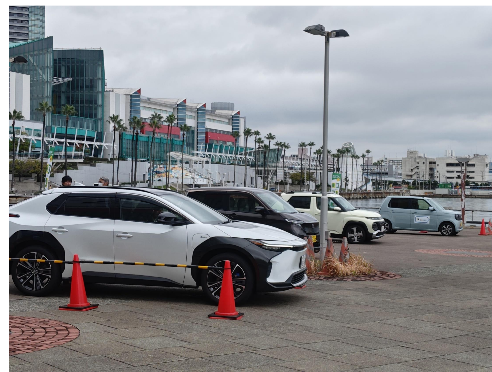
イベントでの乗車体験