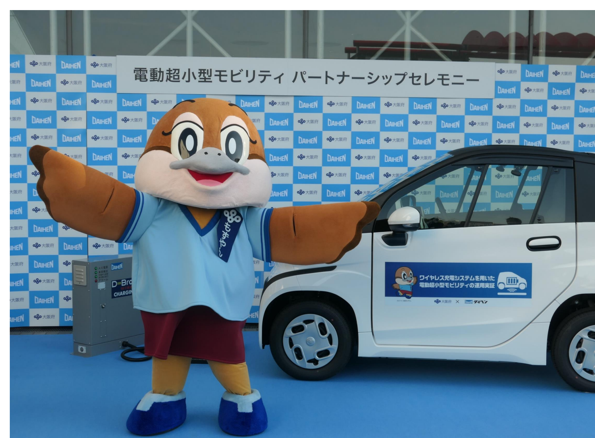
実証開始セレモニー

大阪府咲洲庁舎の駐車場にワイヤレス充電システムを設置し、電動超小型モビリティを公用車として庁内カーシェアする運用実証を行っています。