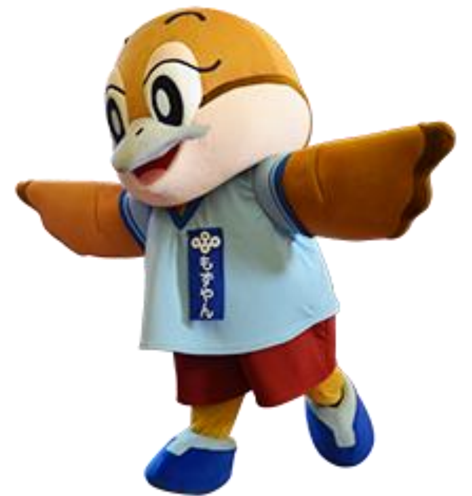
大阪府広報担当副知事もずやん