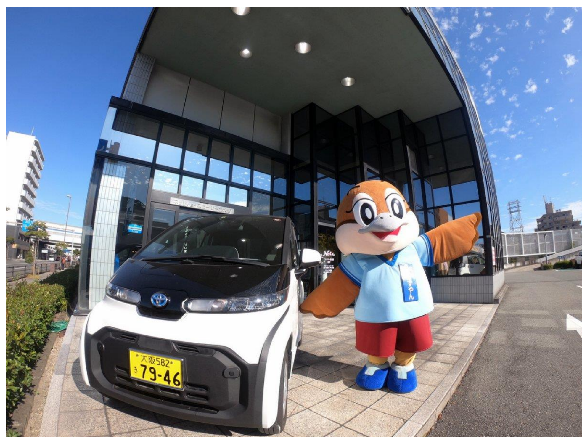
ディーラー店舗での乗車・給電体験

イベント等において、ゼロエミッション車の展示、乗車による走行性能の体感、ゼロエミッション車の給電機能の体験等の機会を提供します。