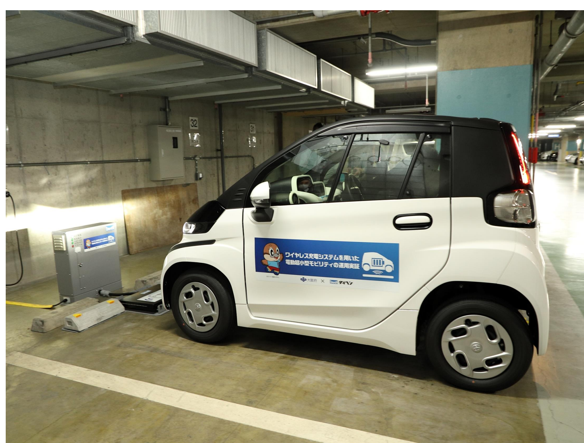
ワイヤレス充電システムによる充電