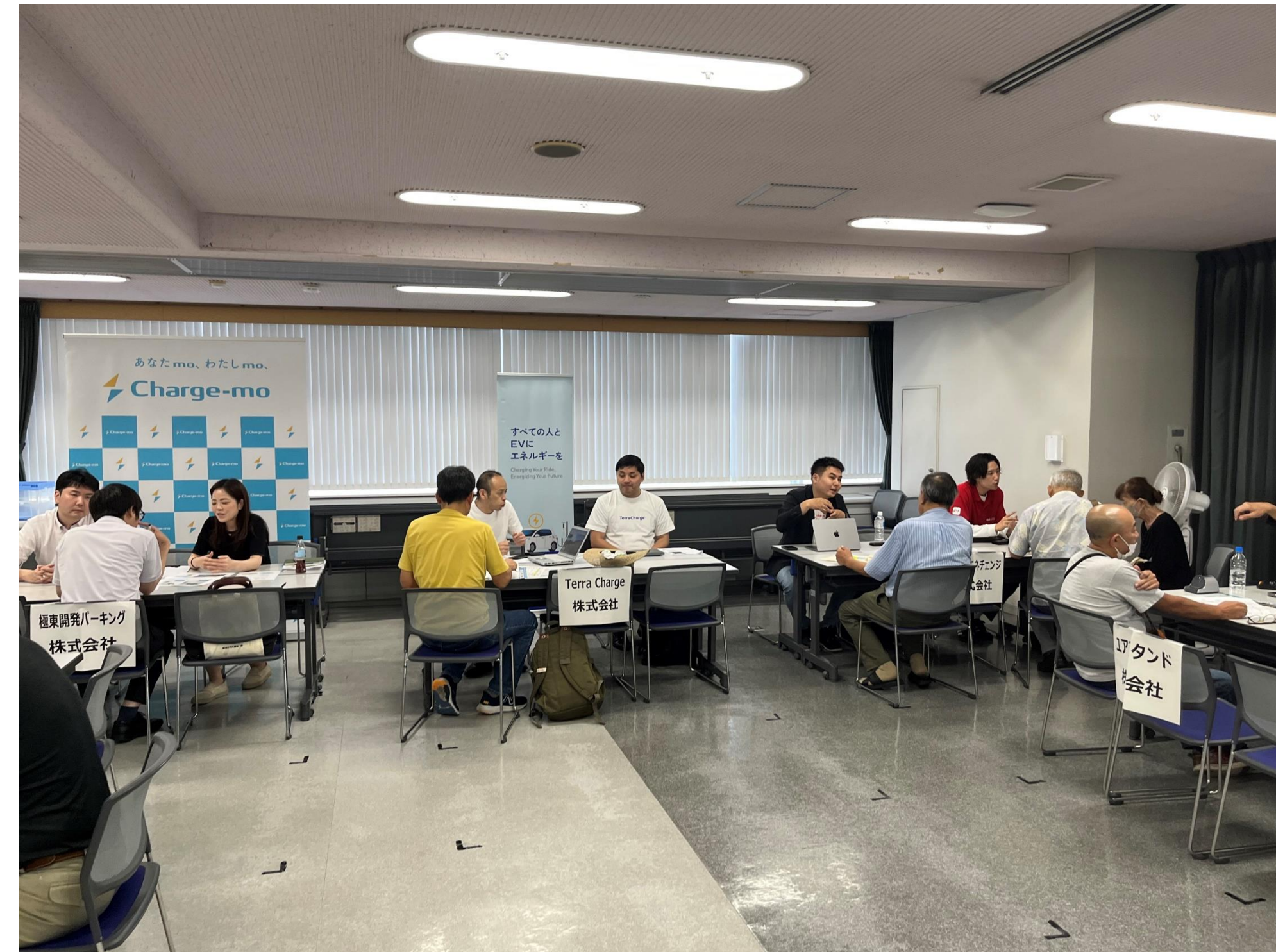
マンション管理組合や管理会社を対象とした説明会の開催