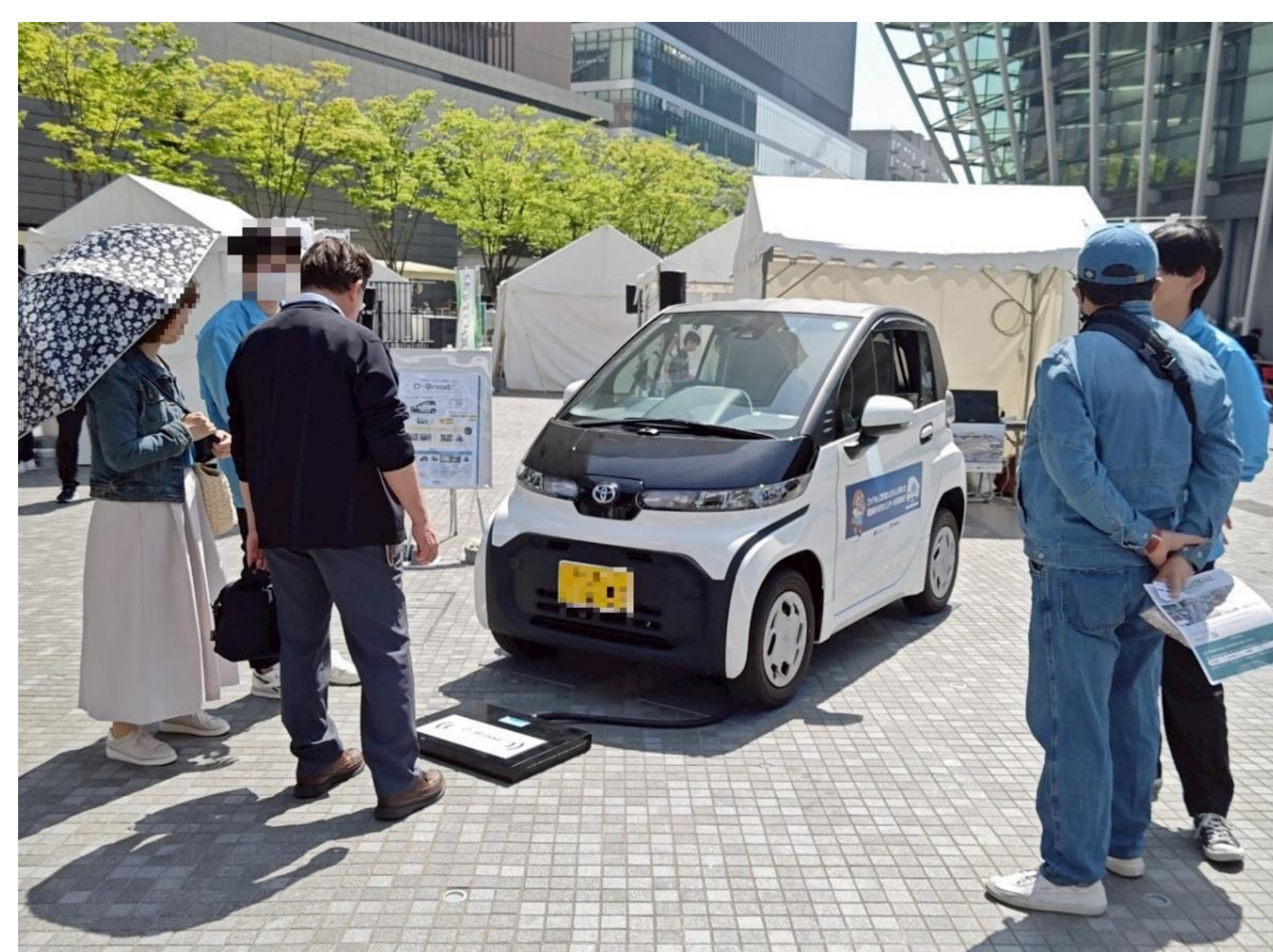
イベントでのワイヤレス充電のPR