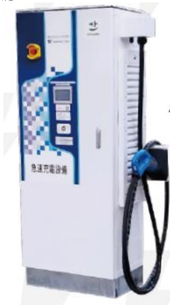
①- 4 の例