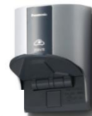
①- 1 の例