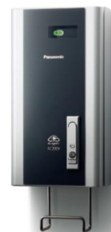
①- 2 の例