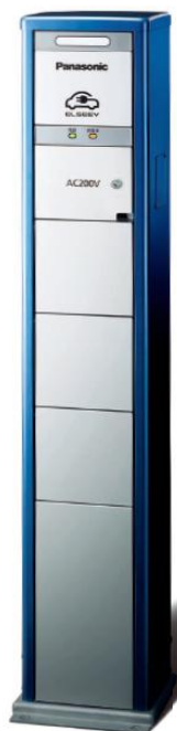
①- 3 の例