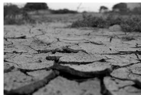
水不足のイメージ図