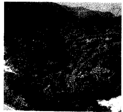
〈和泉葛城山ブナ林〉

ブナ林の生育区域を広めるために取得した周辺森林（約46ha）について、(財)大阪みどりのトラスト協会が行う保全整備・管理事業について助成した。