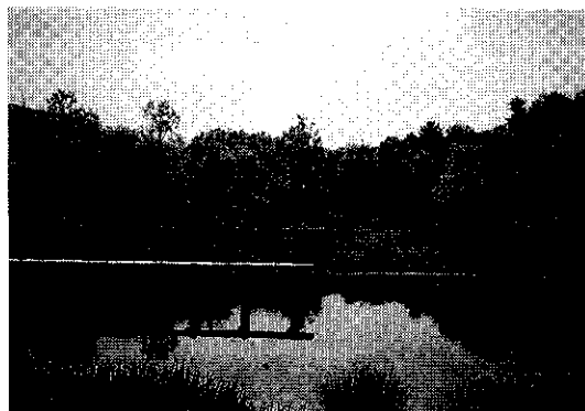
〈信太山湿地保全事業（和泉市）〉

さらには、市街地等の自然度の低い地域での各種事業において、ビオトープの創出に努め、自然の質の向上を図った。