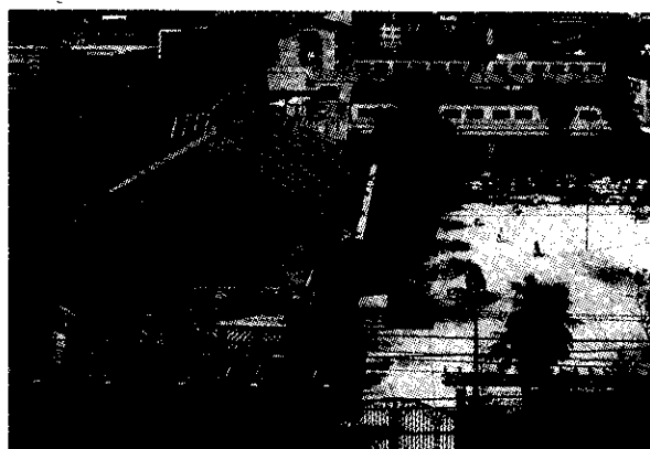
くずはローズ幼稚園（枚方市）