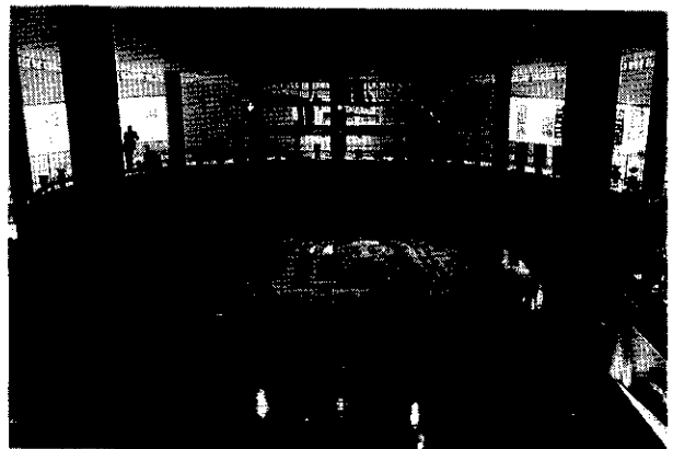
府立近つ飛鳥博物館