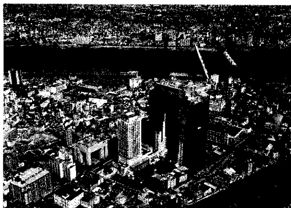
平成6年度 大阪まちなみ賞大阪府知事賞 新梅田シティ