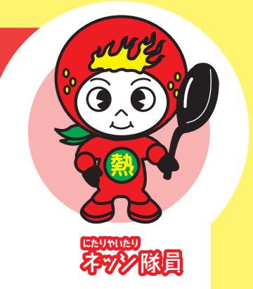
にたりいたり ネカン隊員

ほとんどの細菌やウイルスは加熱によって死滅しますので、肉や魚はもちろん、野菜なども加熱して食べれば安全です。