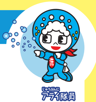
じやうじやうに アライ隊員

手にはさまざまな雑菌が付着しています。食中毒の原因菌やウイルスを食べ物につけないように、必ず手を洗いましょう。 (手洗いの手順は裏面を参照してください。)