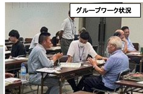
講習会の様子 (岸和田市内)

岸和田市内（R7.8.25）、大阪市内（R7.8.29）において、近畿建設協会の協力のもと、作成支援の講習会を実施