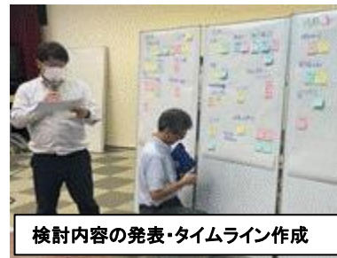
検討内容の発表・タイムライン作成