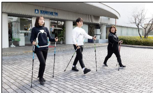
▲ノルディックウォーク&歩行年齢測定