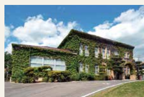
▲国立療養所長島愛生園