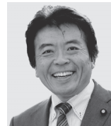
弁護士 仁比 そうへい 現 55歳。参院議員2期。 党参院国対部委員長。 活動地域 中国、四国、九州・沖縄