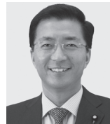
党副委員長 山下 よしき 現 59歳。参院議員3期。 活動地域 大阪、兵庫、滋賀、奈良、和歌山