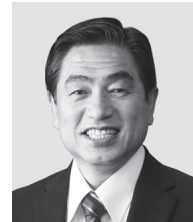
わかすぎ かねしげ 現 若松 かねしげ 現 役職:元復興副大臣、参議議員1期。 経歴:中央大学三部署、公認会計士、 税理士、行政書士。 年齢:63歳 「現場第一」で復興・防災に全力