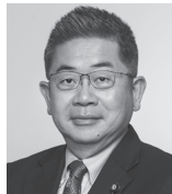
党書記局長 小池 晃 現 59歳。参院議員3期。 全国革新連代表世話人、医師。 活動地域 東京