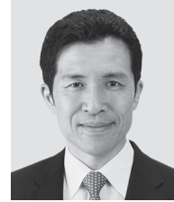
にいづま ひでし 現 新妻 ひでし 現 役職:元文部科学大臣政務官、 参議議員1期。 経歴:東京大学大学院修士課程修了。 年齢:48歳 「ものづくり」でこの国を元気に!