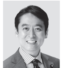
ひらき だいさく 現 平木 だいさく 現 役職:元経済産業大臣政務官、 参議議員1期。 経歴:東京大学法学部卒。 年齢:44歳 未来をひらく 確かな実力!