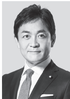
国民民主党 代表 玉本雄一郎