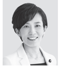
やまもと かなえ 現 山本 かなえ 現 役職:元厚生労働副大臣、 参議議員3期。 経歴:京都大学文学部卒。 年齢:48歳 「あなたの声を、かなえるチカラ。」