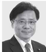
党参院幹事長・国対委員長 井上 さとし 現 61歳。参院議員3期。 活動地域 東海、北陸信越、京都