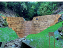
森林区域における 流域治水対策の例