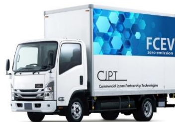
FCトラック（※8トン未満に限る）