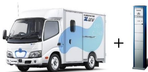
EVトラック（充電設備を含む）