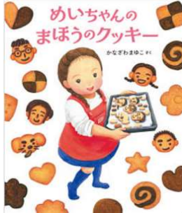
『めいちゃんのまほうのクッキー』 作：かなざわまゆこ BL出版