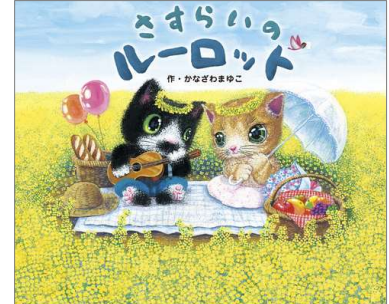
『さすらいのルーロット』 作：かなざわまゆこ 出版ワークス