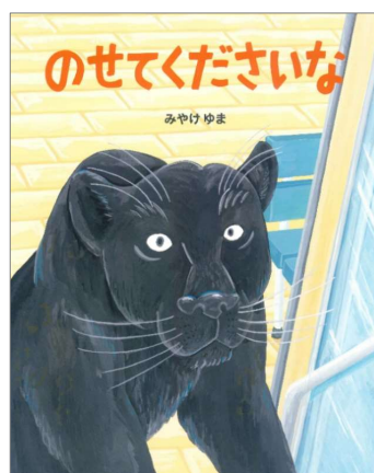
『のせてくださいな』