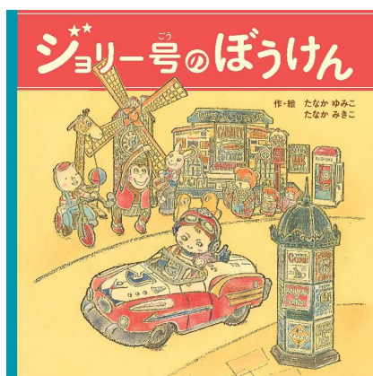
『ジョリー号のぼうけん』