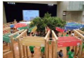
(写真2-1) SDGs体験フェスタ