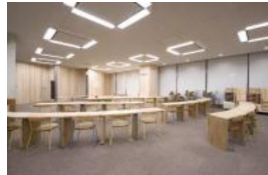
(写真1-1) 大阪市立中央図書館