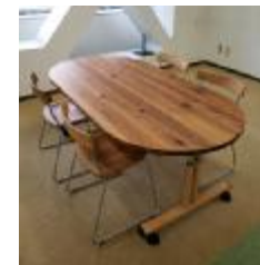
(写真3-3) 区民交流施設