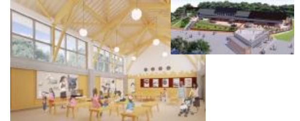
(写真1-2) 天王寺動物園ふれあい家畜・小動物舎 ※イメージ