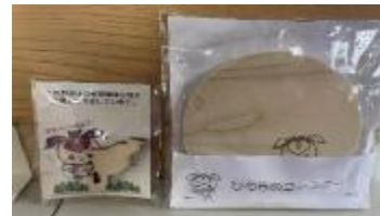
(写真2-2) 木製ノベルティグッズ