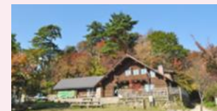
府民の森ちはや園地