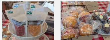
千早赤阪村産の食材や加工品等

金剛山周辺の豊かな水が流れる千早赤阪村で作られた食材や加工品の販売、竹細工の展示等