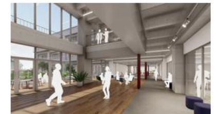
*各画像はイメージ