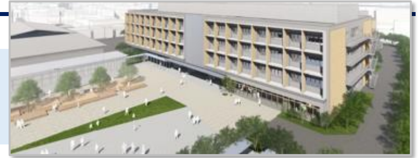
*新設校舎外観イメージ

変革の時代に、知と技をもって次世代型社会の構築に挑むグローバルイノベーターを輩出する学校として、 課題解決型学習を中心とした分野横断的な専門教育を展開し、未来技術の実践フィールドでの体験を通じて、創造力・探究力・実践力を備えた人物を育成する。