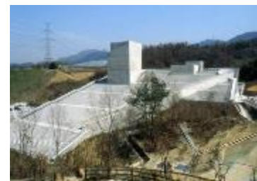
↑ 博物館屋上 大階段