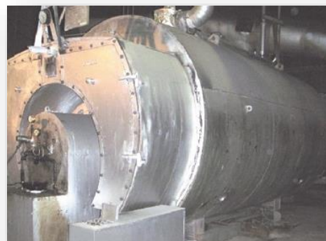
ボイラーの保温材

本年は、同法改正における工作物の事前調査や、石綿分析方法などについて講演を行います。