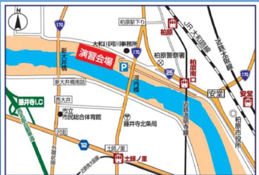
会場案内 (会場には公共交通機関でお越しください)

雨天決行 ただし、災害が発生される場合、河川敷が使用できない場合は中止します。中止の場合は下段の【お問合せ】欄にある大阪府HPIに掲載します。